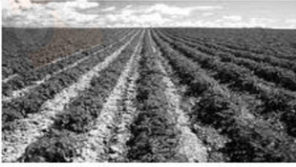
مشهد عدد 3

تبرز المشاهدة التالية ثلاثة مظاهر طبيعية تتدخل الصخور في تكوينها :