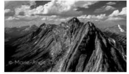
مشهد عدد 1