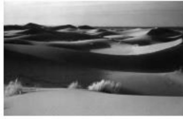
مشهد عدد 2